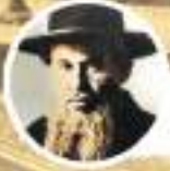
להגאון רבי ישכר שלמה ניינטל זצוק"ל הי"ד