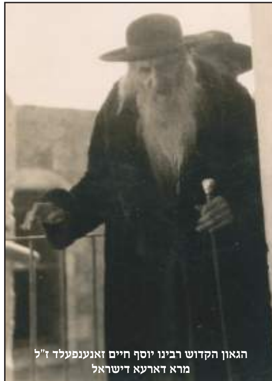
הגאון הקדוש רבינו יוסף חיים זאנענפעלד ז"ל מרא דארעא דישראל

בוילנא בהסכמת גדולי דורו, שהיה בעל בית סוחר יער, ועשה ספרו הנפלא הנ"ל לשם שמים, וכותב שם בהקדמה, וז"ל: 'צייירתי לי בדמיוני, שהרעיון הזה הקדוש מוסכם מכל צד ואין מי מכל אחי בית ישראל שיחשוב אחרת, ולתמהוני ראיתי, כי לא כמחשבותי כן הוא, כי הרבה מאחינו הינם רחוקים מאד מזה, ורבים עוד אשר ירהבו עוז בנפשם להרחיב פה ולשון ולדבר אשר אין להעלות על כתב, עד כי לא אחת קרה לי להיפגש בוויכוחי דברים עם מרחיבי פה ולשון אלה, אשר לא יסרו בדברים של טעם כי אם בשבט פה בגערת מדון'. וכן כתב עוד שם, כי לא אחת הביא לו יד המקרה בהיפגשו בדברים עם אלה אשר ה' בירכם