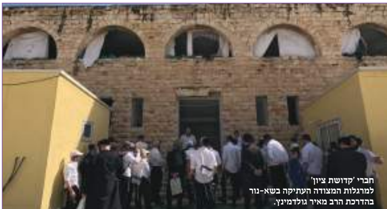
חברי 'קדושת ציון' למרגלות המצודה העתיקה בשא-נור בהדרכת הרב מאיר גולדמינץ.

על שם כפר זה נקרא הישוב חומש, ובהמשך המאמר נראה, כי הוא קשור בטבורו לישוב שא-נור המתחדש כעת.