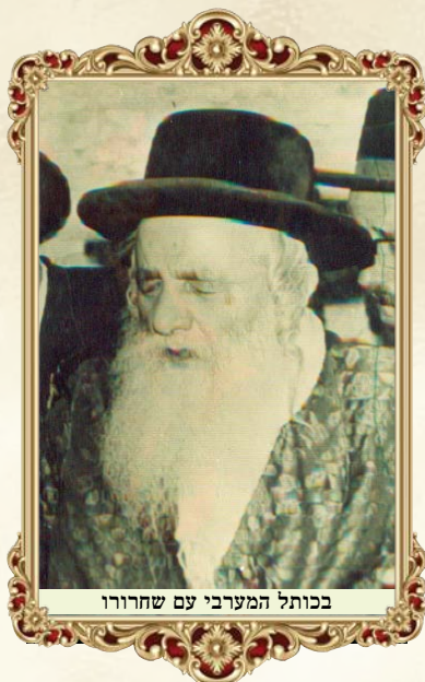
בכותל המערבי עם שחרורו

[*] מתוך אגרת לכ"ק אחיו ה'זכר חיים' זצ"ל