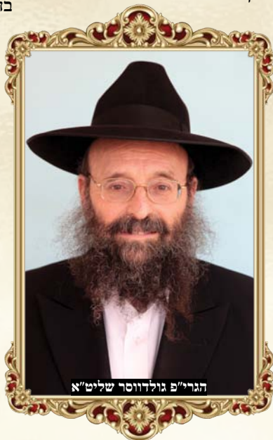
הגרי"פ גולדווסר שליט"א

חמישים מורה על דבר שלם וקדוש, לכן גאולת קרקע של ארץ ישראל היא (ויקרא כז טו) - 'זרע חמר שְׁעָרִים בְּחַמְשִׁים שֶׁקֶל כֶּסֶף'. ערך הזכר הוא מבין עשרים עד חמישים (ויקרא כז ג) - 'חַמְשִׁים שֶׁקֶל כֶּסֶף בְּשֶׁקֶל הַקֹּדֶשׁ'. וכמובן, מצוות היובל (ויקרא כה) - 'וְקִדְשָׁתֶם אֶת שְׁנַת הַחֲמִישִׁים שָׁנָה וְקִרְאתֶם דְּרוֹר בְּאָרֶץ לְכָל יִשְׂרָאֵל'. {הארכת על סוד המספר חמש [חמישים] שהוא ענין השלימות בחוברת שהוצאתי - 'הקול החמישי' [גם אותה ניתן יהיה להשיג בוועידה].