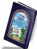
בית ראובן מדריך מקיף לקניית בית מתוך רוגע שמחה והודיה

להשיג בפלאפון: 055.6785647 - משלוחים עד הבית