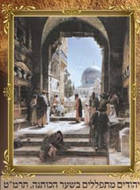
יהודים מתפללים בשער הכותנה, תרמ"ט