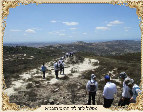
מסלול להר ליד חומש תובב"א