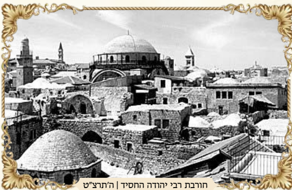
חורבת רבי יהודה החסיד | ה'תרצ"ט

בתבוננות מעמיקה נכתבי הגר"א והתלמידים ומעשיהם בארץ בתקופה של שנת תק"ע - ת"ר, משתקפת האמונה היוקדת, ולפיה במעשיהם הם פועלים לקרב את הגאולה באתערותא דלתא. ביאתם לארץ היא בבחינת קיבוץ ופקידה, וכוונתם למסור נפשם על הארץ, ולאו דווקא לשם התעלות ופרישות גרידא