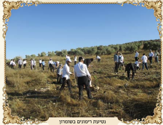
נטיעת רימונים בשומרון

משם צפינו מן הים אשר במערב, מתל אביב עובר ארובות חדרה דרך הרי הכרמל, עד עפולה והרי הגליל הנשאים באופק. סיבוב ימינה לכיון מזרח לקח אותנו להרי הגלבע בואכה הרי הגלעד שבעבר הירדן. למרגלותינו ראינו את העמק הענק והמרהיב, כאשר ממול בולטת הגבעה עליה היה בעבר הישוב 'שא-נור' שלדאבוננו חרב בתכנית ההתנתקות, ראינו גם את המצודה הבריטית סביבה נבנה הישוב. מזרחית לשם ראינו את אגם שא-נור הענק, שבימות הגשמים מלא מים, עד שנקרא משום כך "הכנרת של השומרון", ובימות החמה כולו פורח למראה משוכב עין. צפונית לשא-נור ראינו אזור דותן, והבנו את הדרך שעשה יוסף כאשר הגיע לשם משכם, כמו גם מדוע עברה אורחת הישמעאלים שנשאו צרי ולוט דוקא דרך דותן בירידתם מגלעד מצרימה, שם משכו את יוסף מן הבור לאחר שעברו דרכו, באזור הבור הנקרא כיום 'בור יוסוף'.