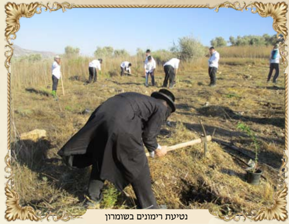
נטיעת רימונים בשומרון

טיפסנו להר הסמוך לחומש מצפון, כשעל אם הדרך נמצאים כורות מים, מערות ועצי תאנה, כאשר נפשותינו מתפעלות למראה זקנים ונערים, מחבבים כל כך כל רגב בארצנו הקדושה, מהם במסירות נפש של ממש למרות גילם המתקדם וגוום המזדקן. אין מי שלא התעורר ברגשי קדושה לארצנו החביבה כל כך, על נותנה הקב"ה, ועל בניה בני ישראל.