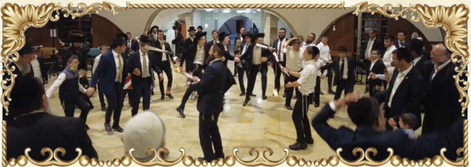
כחלק מהפעילות המבורכת להגדלת השמחה בירושלים המקודשת, נערכה שמחה מיוחדת עלידי 'קדושת ציון' בשיתוף כולל 'צילו של היכל' בראשות הגר"א ובנצל שליט"א, בה זכינו לשמחה ולרקוד יחדיו לפני ה', ובעזרתו ניזכה בשנה הבאה לשמחה כולנו יחד בבית מקדשנו ותפארתנו. לפניכם תמונות מהשמחה.

ירושלם ויהודה נפל' (ב), וזה יהיה להם לעונש על שהלכו בעצת הרשעים ולא בדרך צדיקים, עד - 'כי לשונם ומעלליהם אל ה' למרות עני כבודו' (ט), שמקביל לשיא הקלקול המתואר בחלק האחרון שבתאור קלקול העם בראשית חזון ישעיהו - 'נאצו את קדוש ישראל נזורו אחרו'. ומפרש עוד, כי מה שהביאם למרידה נוראה כל-כך, הוא כי 'הקרת פניהם ענתה בם וחסאתם סדם הגידו לא כחדו', והן שתי השחיתויות הנקובות מעלה. 'הכרת פניהם ענתה בם' היא ענות פניהם, שהיא המביאה אותם לחטוא, כמו שאמר חז"ל (מס' דין לך פ"ו ה"ט) - 'כל מי שאין לו כושת פנים במהרה הוא חוטא, שנאמר הכרת פניהם ענתה בם'. ועיקר החטא הבא מענות פנים הוא בזנות, כמו שכתב בח"ג (ס' כט, וע"ע פסחים מט: מ"ט כ). 'וחטאתם כסדום הגידו' - כנגד החטאים שבין אדם לחברו, כמו שכתב כאן המלבי"ם, כי הוא היה עיקר רעת סדום.