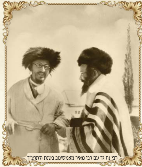
רבי נח גד עם רבי מאיר מאמשינוב בשנת ה'תרצ"ד

מפולין הרשעה, וביום י"ז שבט באתי לארץ ישראל. וביום ט"ז שבט יצאתי ממצרים ללכת לארץ ישראל, ואמרתי רמז וישע ביום ההוא. ביום עולה נח. הוא עולה טוב כי בטו"ב שבט נצלתי ממצרים ובאתי לארץ הקדושה כי אצל מעבר סואץ הייתי בליל י"ז שבט בחצי הלילה, ששייך עוד למצרים, ועברתי את מעבר סואץ בליל י"ז שבט בחצי הלילה שנת תרפ"ד, ובבוקר כבר הייתי בארץ ישראל ובאתי לירושלים עיה"ק תוב"א בשעה תשע וחצי טו"ב שבט שנת תרפ"ד ביום ד' פרשת יתרו. וברוך ד' אשר הציל אותי ואת אשתי ובתי מתחת יד פולין ומכ"ש עכשיו מתחת יד מגוג הרשעה והש"י ירחם על עמו ויהיה די לצרות ישראל ונראה במהרה מפלתו וישמחו עליונים ותחתונים בישועת ישראל בקרוב במהרה ידין אמן".