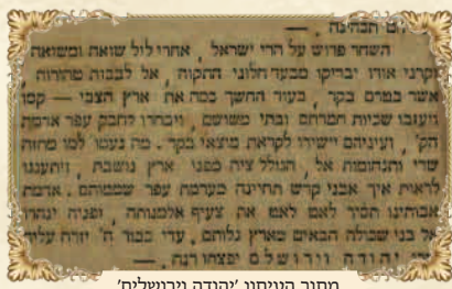
מתוך העיתון 'הודה וירושלים'

בספד"צ בביאור הגר"א, וז"ל: "וד"ס שיעור ימות המשיח כשיעור עטרת ביסוד" [1] . ורבנו ר' אברהם שמחה מאמצילב תלמיד הגר"ח מוולאזין מסביר את הדברים מפורשות על שנת ת"ר, שאז הוא שיעור העטרה בסוד שש מאות שנה, וז"ל: