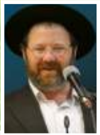
הרב יהודה אפשטיין