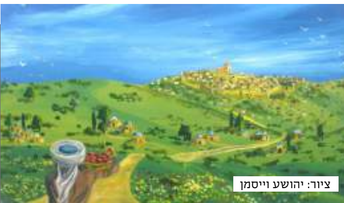
ציור: יהושע וייסמן

התבוננות מחודשת בנסים אלו, כמו שעושים בכנס של 'קדושת ציון' מדי שנה, היא ההכנה הטובה ביותר לחג הביכורים - חג ההודיה על המתנה הנפלאה של ארץ גן העדן - ארץ ישראל.