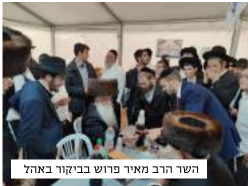
השר הרב מאיר פרוש בביקור באהל