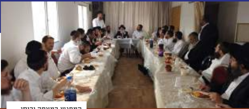
המפגש במצפה יריחו

"שמו פניהם לצפת כי שם קבר איש א-להי הרשב" במירון והאר" בצפת וכו' וירושלים נשכחה לגמרי והוא עיר שם ה' שמה שגם בזמן הזה מצוה לעלות לרגל לירושלים וכו' לא שם איש על לב אלא לעלות לצפת להילולא דרשב" וכו'". כך הגיע עם כמה משפחות נוספות לחוג את חג השבועות הסמוך, בעיר העתיקה בירושלים המקודשת.