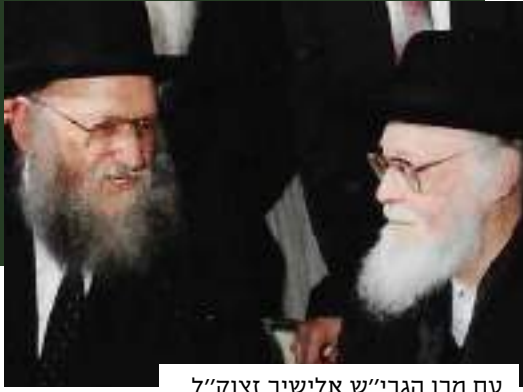
עם מרן הגר"ש אלישיב זצוק"ל

אם היהודי הזה יסגור, יהיה קידוש ה' כפול. יהיה קידוש ה', כי ה' כרת אתנו את הברית של השבת שהיא אות בנינו וביניכם, והקידוש ה' השני - שבארץ הקודש סגורה חנות בשבת". הוא ראה את הקדושה של ארץ ישראל בכל דבר.