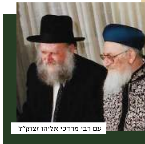
עם רבי מרדכי אליהו זצוק"ל