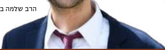
הרב שלמה בריז