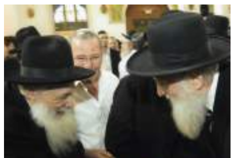
עם מרן הג"ד אביגדר נבוצל שליט"א בחנוכת בית כנסת החורבה

היינו בבני ברק, אצל הרב מאיר צבי ברגמן, אצל הרבי ממודז'יץ והרבי מאלכסנדר הקודם, אביו של הרבי שליט"א. כשחזרנו, השעה היתה 2 בלילה, וסבא לא אכל כלום כל היום. באותה תקופה, היה לו מאוד קשה נפשית. הוא פתח את הבית, בבית היה לו ארון קודש, והוא פשוט בכה מעל