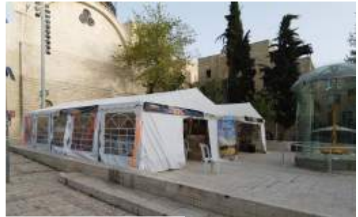
אהל קרית מועדנו - פסח תשפ"ב

המקדש עומד בחורבנו, על ענין השמחה לפני ה' ברגל, וכן על המעלה הגדולה של סיפוק צרכיהם של עולי הרגלים. מי מאתנו אינו מכיר את הסיפור על נקדימון בן גוריון (תענית יט:)? נקדימון לוה מעיינות מים מהגמון אחד עבור עולי רגלים, והקב"ה הוריד עבורו גשם ברגע האחרון ממש כדי שלא יצטרך לשלם.