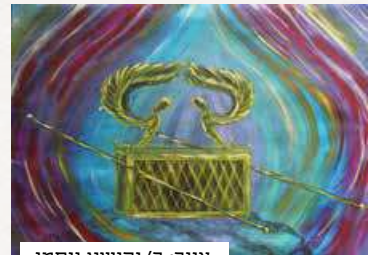
ציור: ר' יהושע ויסמן

בית המקדש הרם והנישא, בית ה' אשר נכון בראש ההרים ונישא מגבעות. נעתקת נשימתי אל מול המראה, זהב וכסף ונחושת, כהנים בעבודתם, לויים בדוכנם וישראל במעמדם, בבית א-להים מהלכים ברגש, מפיסים הכהנים, ומתחילה העבודה.