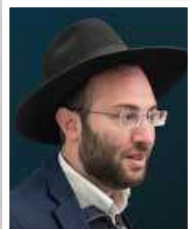
הרב חיים מאיר אינהורן