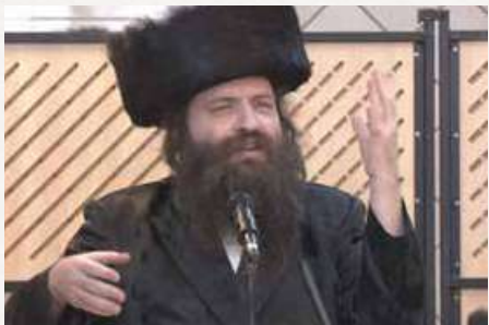
הגאון רבי משה שוויצער שליט"א חיזק אותנו בדברים חמים ונלהבים,

עלינו לפעול בתעמולה אצל בני חוץ לארץ, אבל גם פשוט להסתכל עליהם בצורה הנכונה ולהביע זאת בפניהם - איך יתכן שהם מאפשרים לעצמם להיות ככזו תחתית רוחנית ולהעיד עדות שקר בנפשם בכל תפילה ותפילה ולהוציא עצמם מכלל ישראל ומשכינתו יתברך החוזרת לארצה?! וגישה זו, כאשר תובע בפניהם שוב ושוב, תרז בפועל את עלייתם ארצה במהרה.