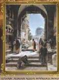
יודים מתפללים בשער הכותנה הישן