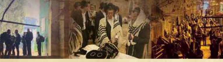
(מתוך פיוט שתיקנו הגאונים לומר בשערי הר הבית)

קו העדכונים של המנין בשער הכותנה: 079-607-7476 בעז"ה יתקיימו תפילות בשער הכותנה גם בפורים ובזמנים נוספים, עדכונים בקו.