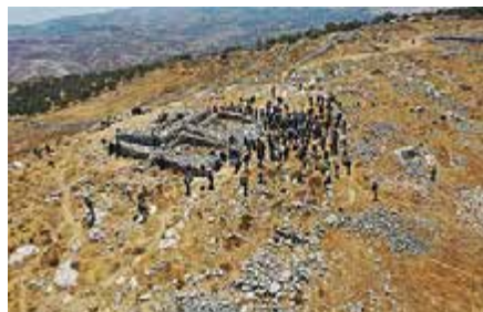
בתמונה: מבט מהאוויר על מזבח יהושע בהר עיבל.

לא חפר באתרים שמצא, אלא רק סימן אותם. אדם זרטל תר ברגליו 8 את נחלת מנשה לאורכה ולרחבה 9 , וסימן במפה כל אתר שמצא. היכן הוא נמצא, מה רואים על פני השטח, מה שמו בפי הערבים,