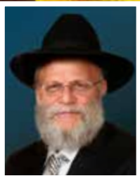
הגאון רבי חיים זאב מלינוביץ' צ"ל