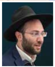
הרב חיים מאיר אינהורן