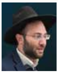
הרב חיים מאיר אינהורן