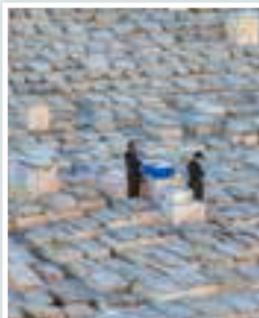
קבר רבי חיים בן עטר