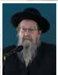
הרב בצלאל גינז