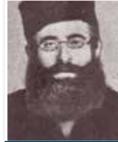
רבי ישראל מסטולין האדמו"ר מקרלין

בשנת תרפ"ח החליט הערבי בעל המקום למכור את החצר לכל המרבה במחיר. משפחת וינגרטן חפצו לגאול את המקום, וביקשו