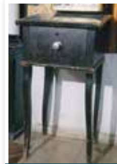
עמוד התפילה ששלח רבי אהרן מקרלין לטבריה