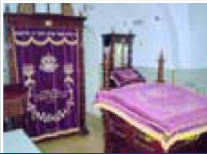
בית הכנסת אור החיים

סיפורו של 'בית הכנסת אור החיים' בו היתה ישיבתו של האור החיים הקדוש, הוא סיפור מרתק מלא גלגולים של מסירות נפש לגאולת וקדושת ארץ ישראל.