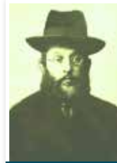
רבי אברהם אלימלך מקרלין

מסע, לפאר בית קדשנו ותפארתנו. מהראוי להיות לעזר ולסעד להם בעין יפה ורוח נדיבה. וע"י מקנת כספם יהיה חלקם בארץ החיים, במקום המקודש בעשר קדושות וכל ביה עשרה וכו'.