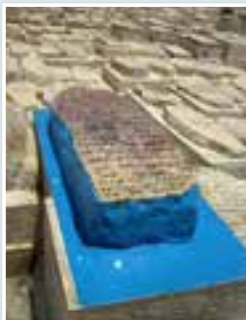
קבר האור החיים