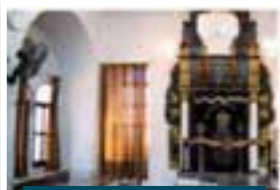
בית הכנסת העתיק של חסידי קרלין בטבריה

העתיק של רבי מנחם מנדל מוויטבסק שמתחת לבית הכנסת, ורבי אהרן שלח אליהם ספר תורה שסיים לכתוב, תיבה ועמוד תפילה מעץ.