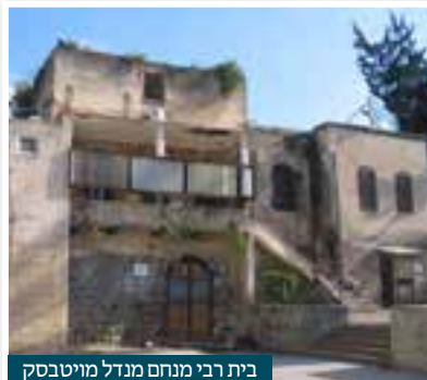
בית רבי מנחם מנדל מוויטבסק

בשנת תרל"א החלו בניית בית הכנסת מעל ביתו של ר' מנחם מנדל, ונעצרו כעבור זמן קצר בשל חובות. בצר להם יצאו שוב, בשנת תרל"ג, שליחים לחצרות קרלין סטולין ולקהילות החסידים ברחבי פולסיה וואהלין כדי לגייס תמיכה כספית. רבי אהרן מקרלין חתם עם בנו, רבי אשר (השני) מסטולין, על קול קורא בתמיכה במפעל. בינתיים, התפללו החסידים בביתו