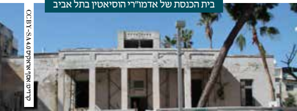
קדימת ארץ ישראל - סא 4000 - CCBY

כל ימיו היה מעורר על אהבת הארץ והחובה לפעול למען ישובה. שגורים היו על לשונו דברי ספר חרדים (פרק נט): "וצריך כל איש ישראל לחבב את ארץ ישראל ולבוא אליה מאפסי ארץ בתשוקה גדולה, כבן אל חיק אמו, ובפדיון הארץ - מהרה תהיה הגאולה" (מאיר צבי גרוזמן, תולדות יעקב - אדמו"רי הוסיאטין, פתח תקווה, תשע"ט, עמ' 156). נלקח לבית עולמו בי"ח בחשוון תשי"ז.