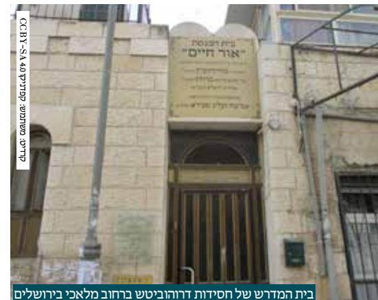
בית המדרש של חסידות דרוהוביטש ברחוב מלאכי בירושלים

בדברי ימיה של העליה היהודית לארץ ישראל, ישנו פרק שמעולם לא נחקר כל צרכו, פרק שלא זכה להתייחסות מספקת בידי כותבי קורות העתים. זהו פרק שנותר סתום וחתום, ורבים כלל אינם יודעים על קיומו. פרק זה, הוא מפעל העליה של צדיקי חצר הקודש רוז'ין. צדיקי בית רוז'ין מסרו את כל כולם למען קדושת הארץ וחיוזוק הישוב היהודי. חלקם אף זכו לחון בעצמם את עפר הארץ הקדושה, יש מהם שסייעו בבנינה במו ידיהם ממש. מה אירע שם? מה גרם לנסיכי השושלת הנודעת בגיבוני המלכותיות וההדר, לוותר