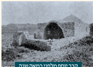
קבר יוסף מלפני כמאה שנה

כעת נדייק שוב את הפסוק, ונבין בו הסבר נוסף, שרק כאשר נמצאים במקומות הללו אפשר להבין אותו. אומר האיש - "נסעו מזה". נסביר כעת, שהאיש מצביע באצבע על הדרך שבה הם הלכו, ואומר "נסעו מזה". כלומר - מדרך זו הם נסעו. וכעת נראה דבר נפלא: יוסף שואל את האיש - "וַיֵּאמֶר אֶת אָחִי אֲנִי מְבַקֵּשׁ הֲגִידָה נָא לִי אֵיפֹה הֵם רְעִים". האיש משיב - מה שאני יודע זה שהם "נסעו מזה" - כלומר, מהאזור הזה הם נסעו, ואני