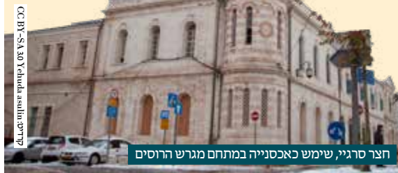
חצר סרגיי, שימש כאכסנייה במתחם מגרש הרוסים

דרשות אלה של חז"ל מזכירות את 'המרוץ' שהתנהל לפני כמאה שנה בין אומות העולם על רכישת אדמות והשפעה בארץ ישראל ובפרט בירושלים. עדות לכך אפשר למצוא עד היום בשמות מקומות שונים בעיר הקודש: 'המושבה הגרמנית', 'הגבעה הצרפתית', 'בית החולים האיטלקי', 'המושבה האמריקאית', 'מגרש הרוסים' ועוד ועוד. נדמה שאין עוד ארץ בעולם, בוודאי לא ארץ כה קטנה, שעמים כה רבים ושונים זה מזה ניסו להשתלט עליה, עמים שרובם שכנו במרחק אלפי קילומטרים ממנה ובכל זאת השתדלו בכל כוחם להיאחז בה. ללמדך שאפילו אומות העולם מחביבין את הארץ הקדושה, ק"ו שאנו בני ישראל צריכים לחבבה עד מאוד.