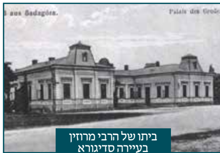
ביתו של הרבי מרוזין בעיירה סדיגורא

"עוד יבוא זמן שאומות העולם ישנאו אותנו שנאת מות, והיות שהם לא יוכלו להפטר מאתנו על ידי רדיפות ושחיטות, הם יזדקו אותנו בבזיון לארץ ישראל. ואף על פי שאין זה כבוד גדול לחזור לארצנו בצורה מבוזה שכזאת, אך כך גם היה אצל פרעה כשיצאנו ממצרים, וכמו שאומר