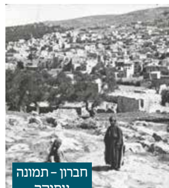
חברון - תמונה עתיקה

רבי לוי יצחק מברדיטשוב, בעת שחרורו ממאסרו ב"ט כסליו תקנ"ט, בוקעת ועולה התקשרות ומסירותו לחיזוק היישוב היהודי בארץ הקודש. מסירות זו