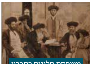
משפחת סלונים בחברון

ברגע היוודע הדבר התעוררה סערת רוחות שהקיפה את כל העולם. אלפי פניות ומחאות זרמו. משנוכחו בטעות ביקשו הנוגעים בדבר מהערבים להסכים להעברת המקום, והללו נעתרו תמורת ויתורים מפליגים. כך ניצל קבר הרבנית מנפילה בידי רשות המחבלים, ואף זכה, לאחר שנים, לבינוי מחדש בתרומת הנגיד הרב יוסף יצחק גוטניק