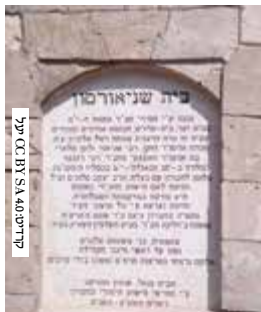
בית שנאורסון בחברון

בית הכנסת שוחזר על פי תמונות ועל פי זכרונות של בני חברון שניצלו בתרפ"ט, וכיום הוא שוב משמש לתפילה. לבית הכנסת הוחזרו ספרי תורה עתיקים שנלקחו ממנו לירושלים לאחר הטבח בתרפ"ט.