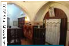
בית כנסת אברהם אבינו בחברון כיום