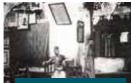
בית כנסת אברהם אבינו בחברון