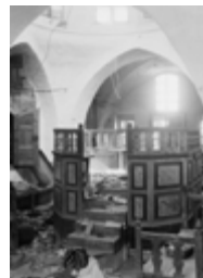
בית כנסת אברהם אבינו חברון תרפ"ט