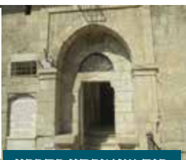
בית שנאורסון בחברון