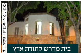
בית מדרש לתורת ארץ ישראל בפתחתקוה