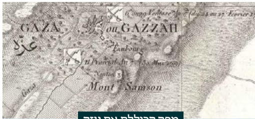
מפה הכוללת את עזה

מעוררות בנו רגש כפי שמעוררת עיר האבות חברון או קבר יוסף בשכם. חלל תודעתי זה סייע בידי ממשלת ישראל לבצע בשעתו