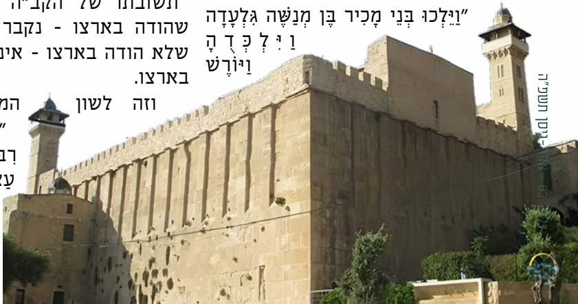
המבצר הגדול בחברון