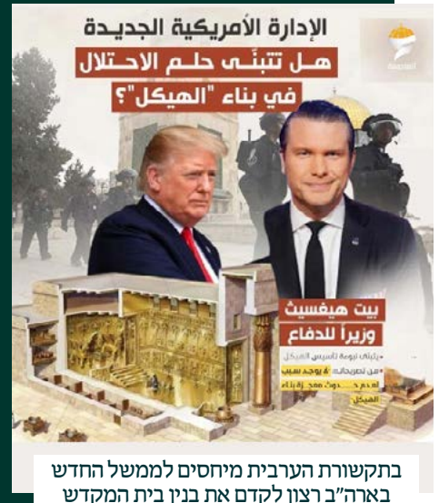
בתקשורת הערבית מיחסים לממשל החדש בארה"ב רצון לקדם את בנין בית המקדש

"אני לא יודע איך זה יקרה, אתם לא יודעים איך זה יקרה, אבל אני יודע שזה יכול לקרות, זה כל מה שאני יודע", אמר. "כל צעד בתהליך הזה, זה חלק מההכרה שיש משמעות לעובדות ופעולות בשטח". "לכן אמישך ללכת לבקר ביהודה ושומרון, ההבנה שריבונות על אדמת ישראל על ערי ישראל וכל המקומות זה השלב הבא והקריטי כדי להראות לעולם שהארץ הזו שייכת ליהודים"